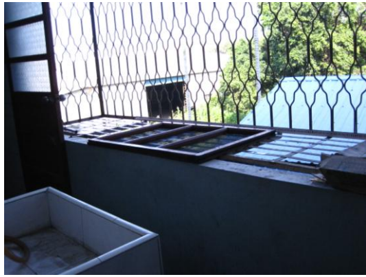
相片七 二樓廁所、曬衣場