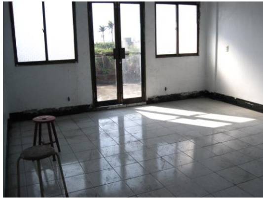
相片十一 四樓前段