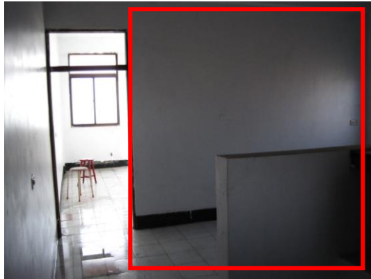
相片十二 四樓中段