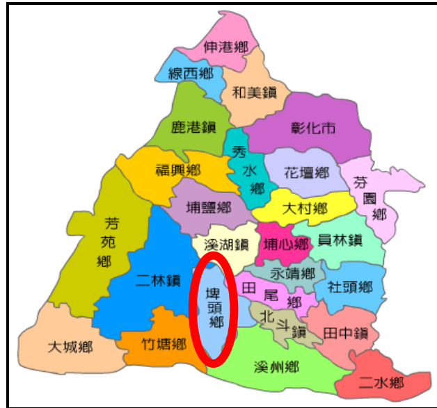
圖一 埤頭鄉與彰化縣其他鄉鎮相對位置圖

埤頭鄉位於彰化縣轄區南端，濁水溪沖積扇上，北臨溪湖鎮，西接二林鎮、竹塘鄉，東鄰田尾鄉、北斗鎮、溪州鄉，南鄰西螺大橋(如圖一)。