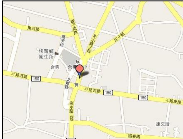
圖三 埤頭鄉召會會所位置圖

會所位於埤頭鄉合興村彰水路三段 752 號(如圖三)，也就是埤頭鄉內兩條主要幹道節點附近(彰水路、斗苑東西路)，其鄰近有 7-11、藥局、郵局、鄉公所、農會，生活機能便利、健全。