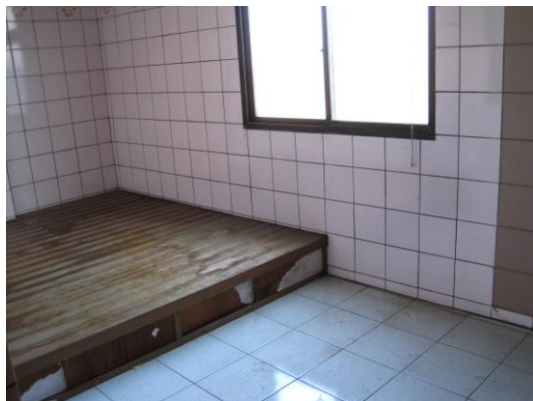
相片十三 四樓後段